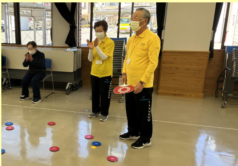
マスクを着用して行われた出前講座でのディスコンの様子（門前生きがいサロン：塩原公民館）

久しぶりの発行となりました「スポ進だより」ですが、新型コロナウイルス感染症の影響により、前回発行した時からは大きく状況が変わりました。スポーツ推進委員協議会でも、いわゆる「コロナ禍」でいかにスポーツの魅力を広めるかを模索しながら活動している状況です。