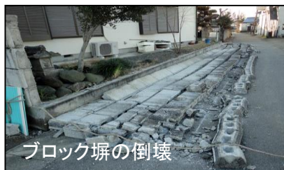
ブロック塀の倒壊