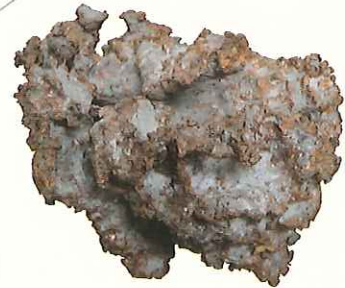
自然銅 Native copper