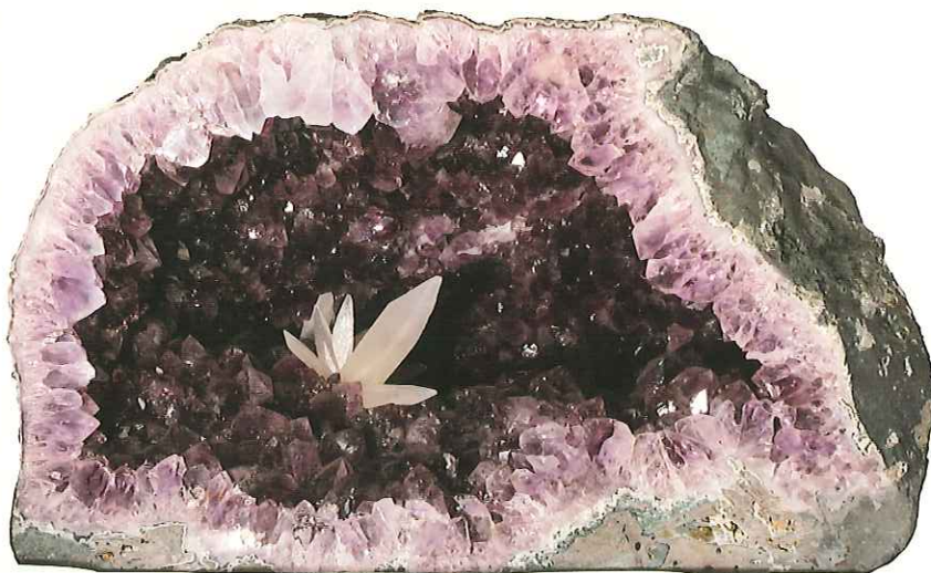
紫水晶と方解石 Quartz(Amethyst) and Calcite