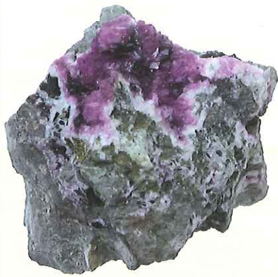
含コバルト方解石 Cobalt calcite