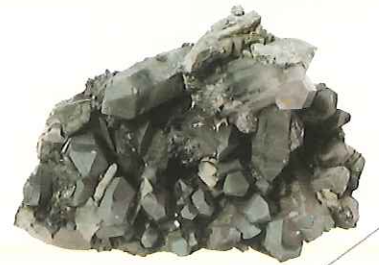
緑水晶 Green quartz