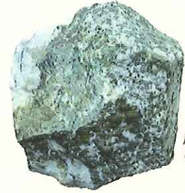
灰クロムザクロ石 Uvarovite