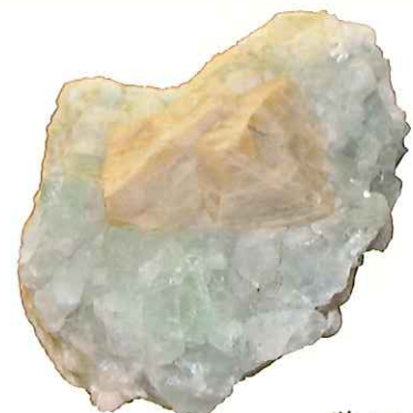
螢石と灰重石 Fluorite and Scheelite