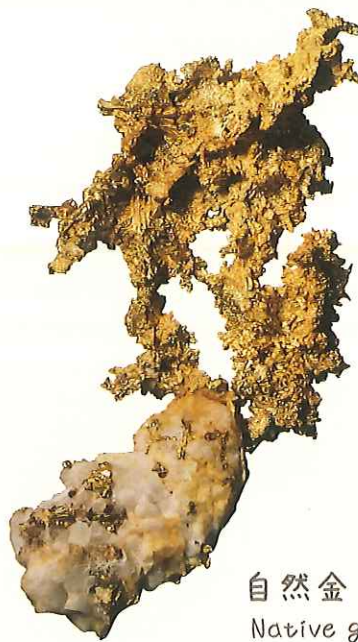
自然金 Native gold