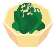
ほうレン草のおひたし 小鉢1皿