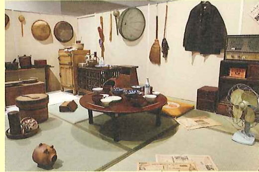
再現ジオラマ(イメージ)