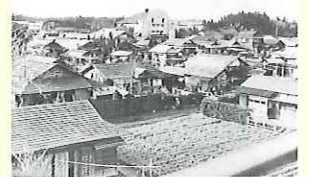
昭和30年代の那須塩原市の風景